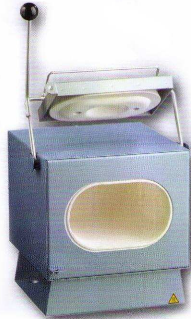
Brennofen Typ "EFCO 180": 99 500 81

Maximale Temperatur: ca. 1100° C Anschlusswert: 230 V~, 1200 W, 6 Außenmaße H x B x T: 300 x 260 x 375 mm Brennraum H x B x T: 85 x 160 x 195 mm, entspricht 2450 ccm Nettogewicht: ca. 8,0 kg