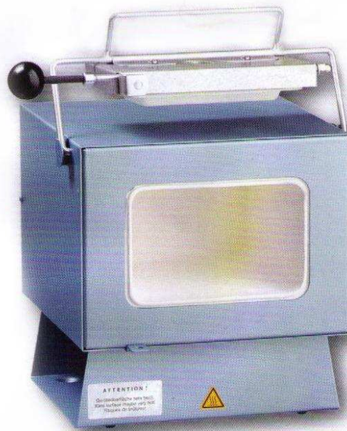
Brennofen Typ "EFCO 135": EUR 341 99 500 31

Maximale Temperatur: ca. 1100° C Anschlusswert: 230 V~, 1200 W, 6 A Außenmaße H x B x T: 250 x 260 x 300 mm Brennraum H x B x T: 90 x 140 x 155 mm, entspricht 1950 ccm Nettogewicht: ca. 6,3 kg