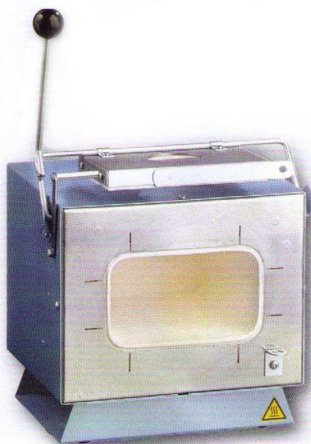
Brennofen Typ "EFCO 110": EUR 280 99 500 51

Maximale Temperatur: ca. 950° C Anschlusswert: 230 V~, 900 W, 6 A Außenmaße H x B x T: 210 x 200 x 250 mm Brennraum H x B x T: 70 x 120 x 130 mm, entspricht 1100 ccm Nettogewicht: ca. 5,8 kg